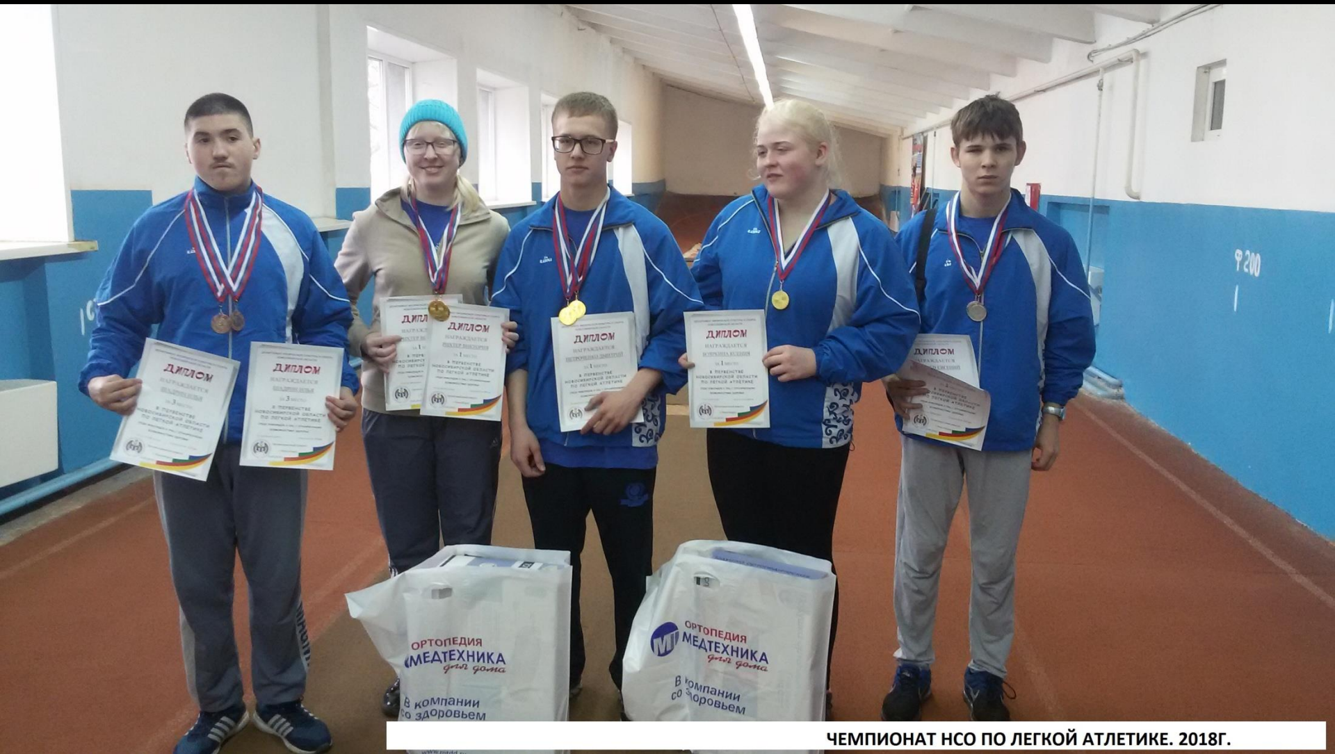
ЧЕМПИОНАТ НСО ПО ЛЕГКОЙ АТЛЕТИКЕ. 2018Г.