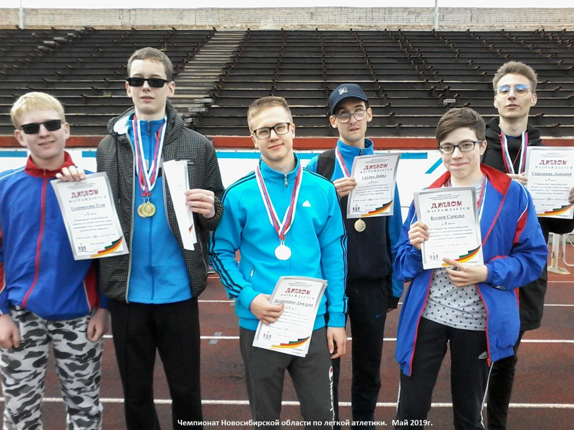
Чемпионат Новосибирской области по легкой атлетике. Май 2019г.