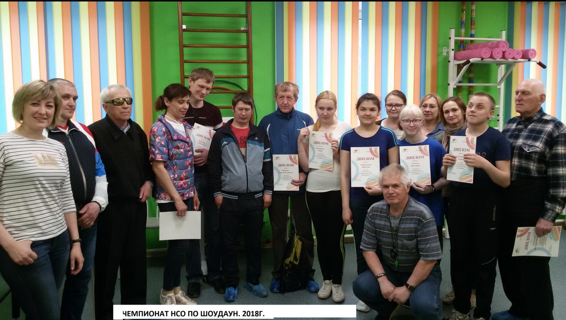
ЧЕМПИОНАТ НСО ПО ШОУДАУН. 2018Г.