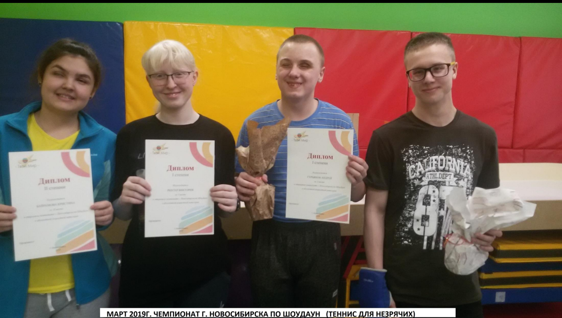
МАРТ 2019Г. ЧЕМПИОНАТ Г. НОВОСИБИРСКА ПО ШОУДАУН (ТЕННИС ДЛЯ НЕЗРЯЧИХ)