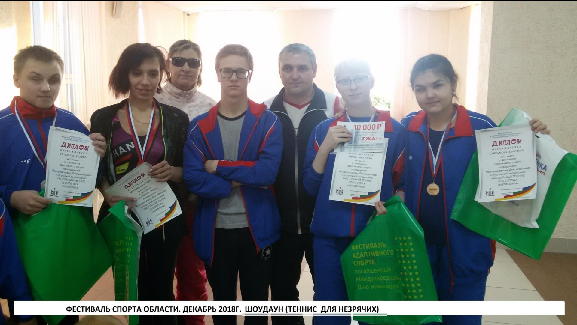
ФЕСТИВАЛЬ СПОРТА ОБЛАСТИ. ДЕКАБРЬ 2018Г. ШОУДАУН (ТЕННИС ДЛЯ НЕЗРЯЧИХ)