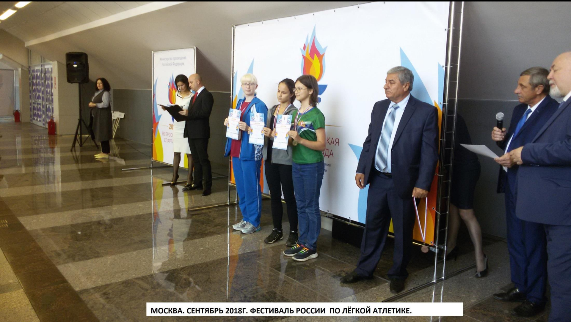
МОСКВА. СЕНТЯБРЬ 2018Г. ФЕСТИВАЛЬ РОССИИ ПО ЛЁГКОЙ АТЛЕТИКЕ.